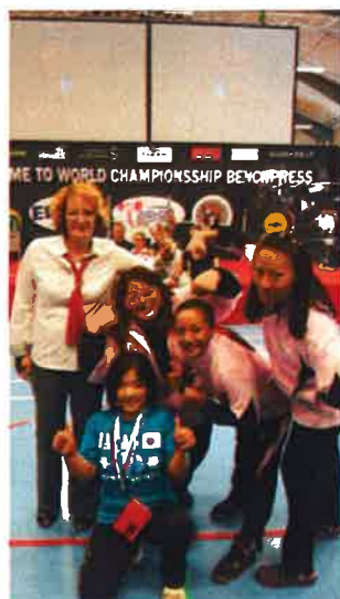
白川選手の優勝を祝ってくれた台湾チームと審判員の女性