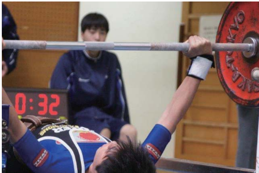
男子53kg級、83kg級は大接戦。