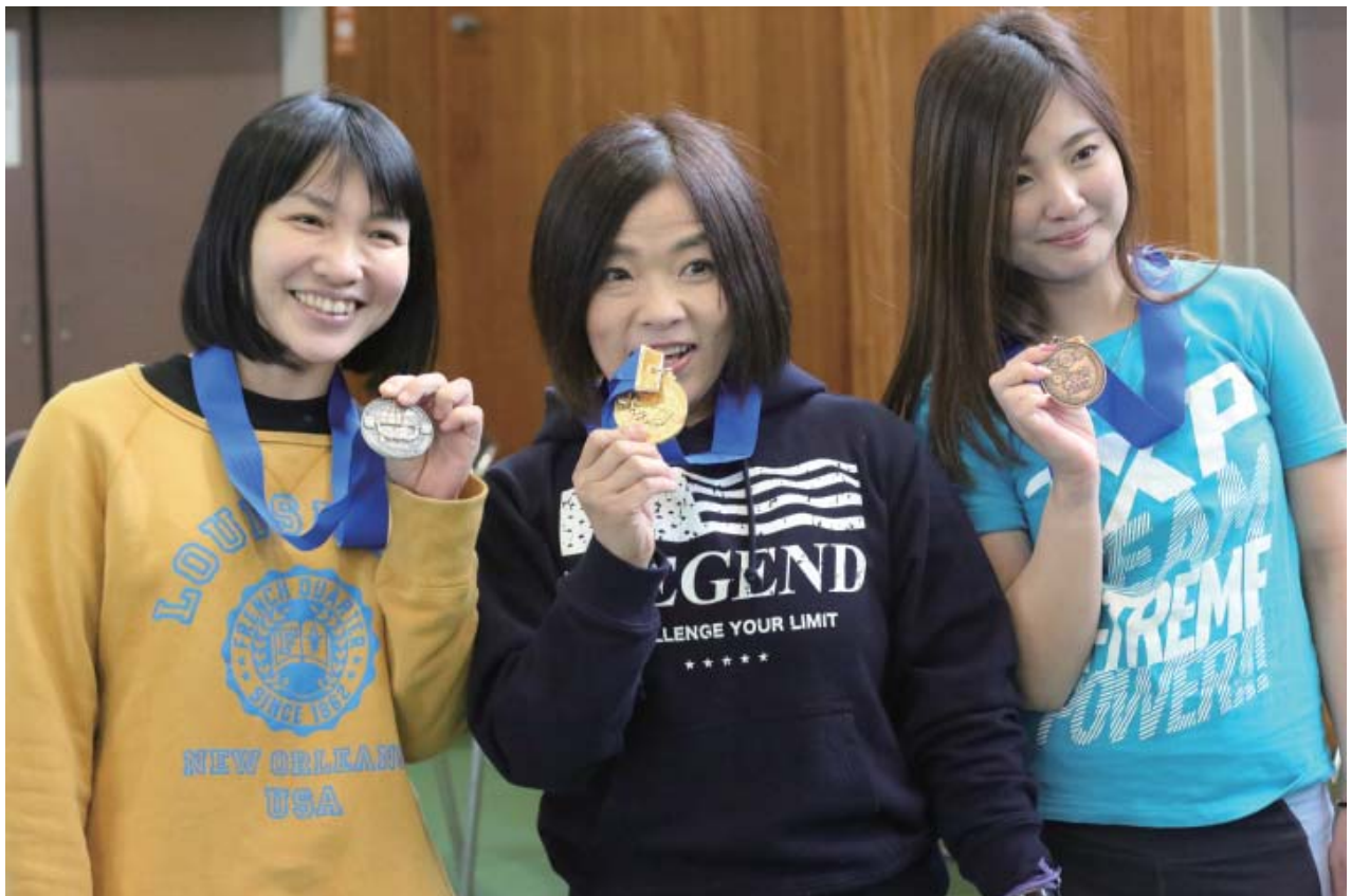
52kg級、試合が終われば、みんな笑顔。