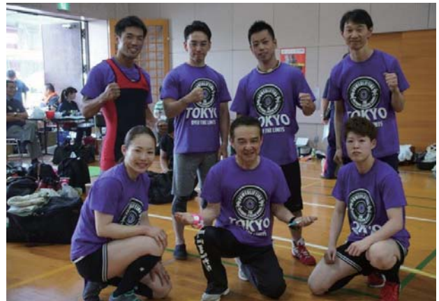
写真右上；ユニフォームをそろえて、国体参戦、東京チーム