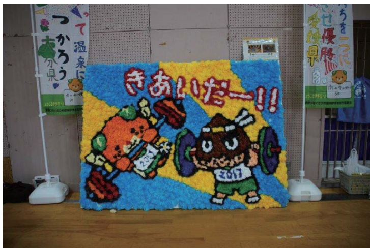
写真下；ポスターとパネル。試合とキャラクター、都道府県とキャラクター、競技をより身近に感じる作戦が。