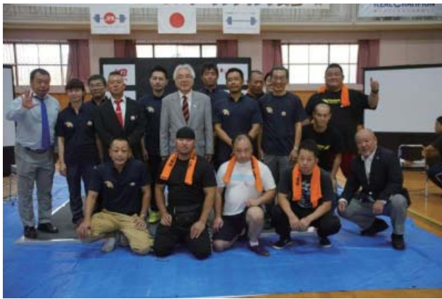
写真上；愛媛国体を支えた JPA, 愛媛県協会、補助団の皆さん